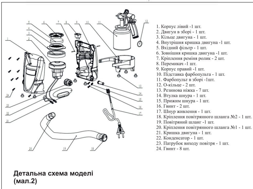
Детальна схема моделі (мал.2)