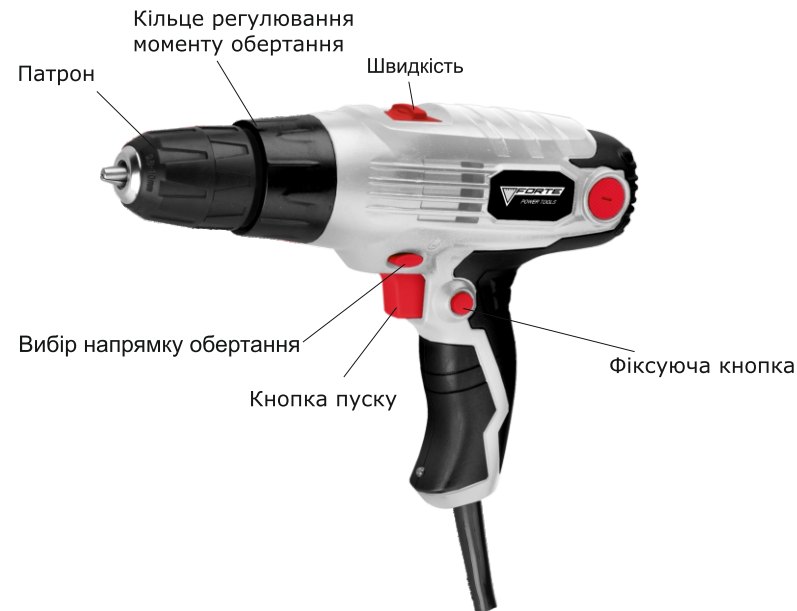
Детальна схема моделі

Рівень швидкості обертання встановлюється перемикачем угорі корпусу шурупокрута.